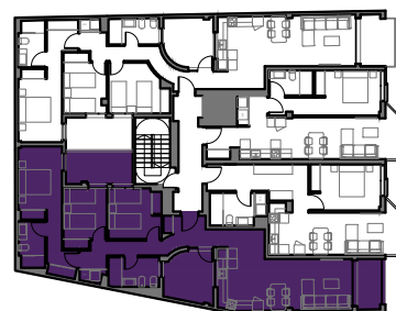
CL GOYA 24-26