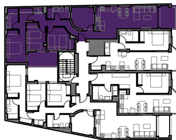
CL GOYA 24-26