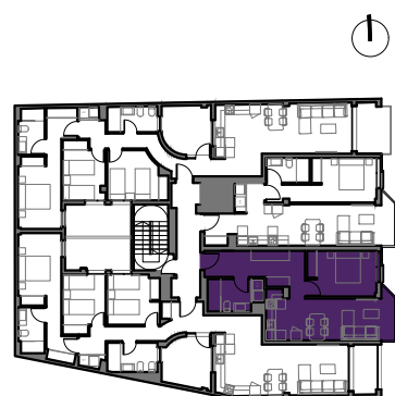
CL GOYA 24-26